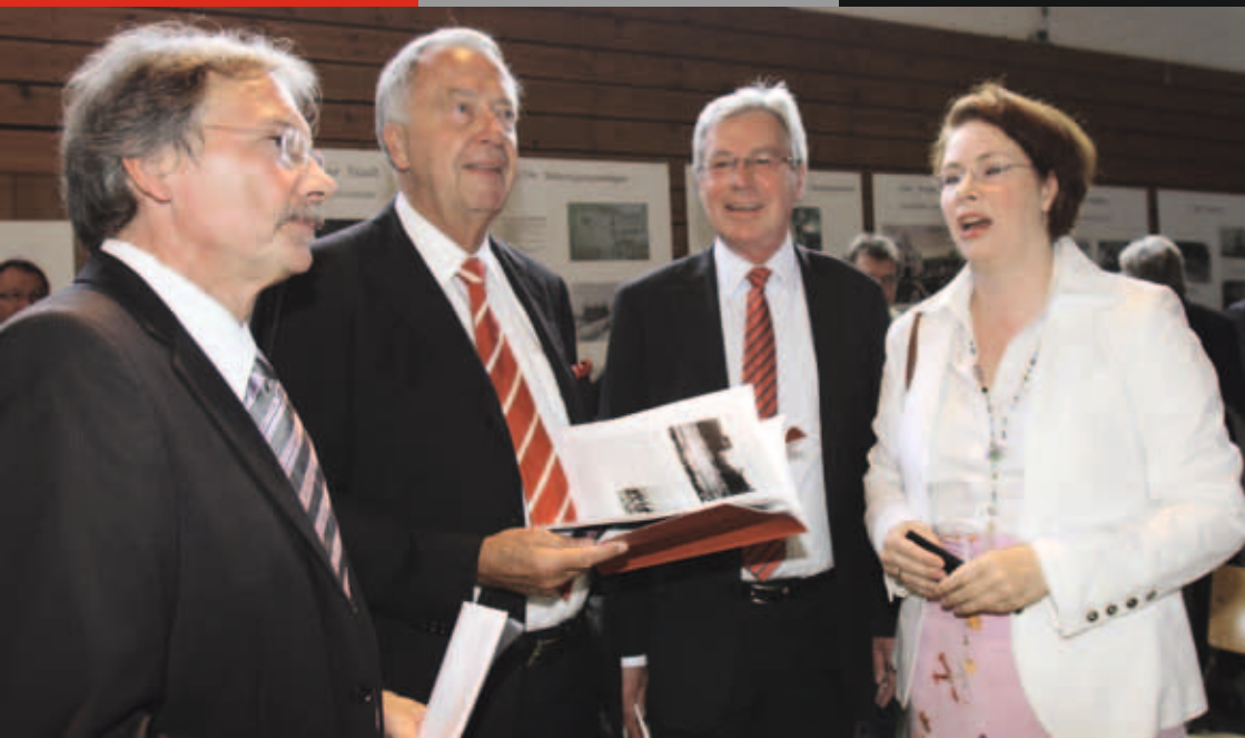
Politische Prominenz beim Festakt am 03.09.2011