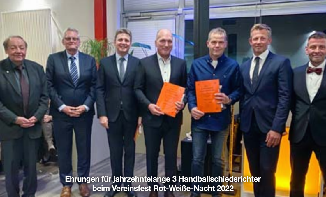
Ehrungen für jahrzehntelange 3 Handballschiedsrichter beim Vereinsfest Rot-Weiße-Nacht 2022