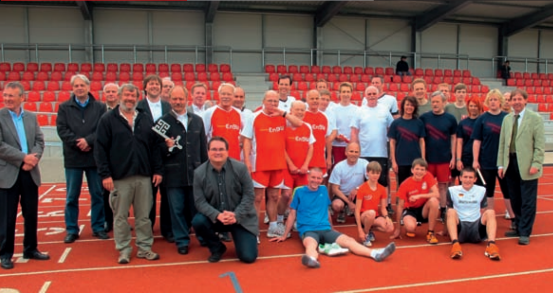
Eröffnung der Stadiontribüne