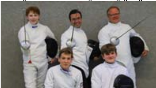
Einige Mitglieder der Fechtabteilung