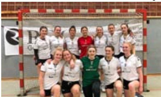
Qualif Vorrunde Oberliga:

Wir freuen uns auf jeden Fall schon sehr auf die neue Saison und hoffen, dass die Mädels einfach nur viel Spaß und Freude an der coolsten Sportart der Welt haben werden :-)