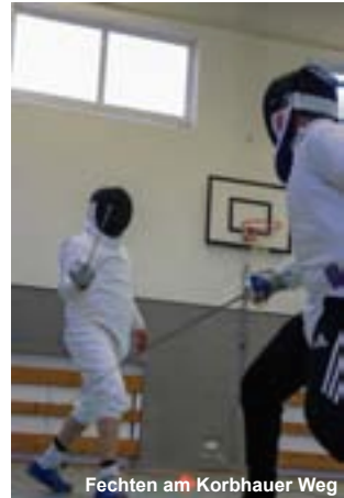
Fechten am Korbhauser Weg