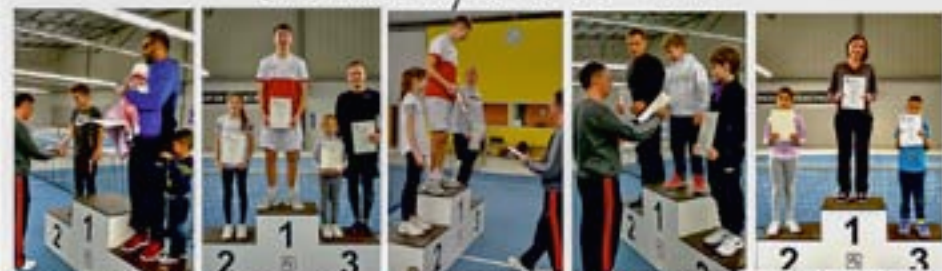
Sieger Gruppe 3