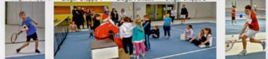
Sieger Gruppe 4