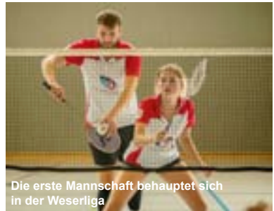
Die erste Mannschaft behauptet sich in der Weserliga

Der Badminton-Sport liegt uns am Herzen..... und Möbel online kaufen könnte durchaus Ihre neue Leidenschaft werden