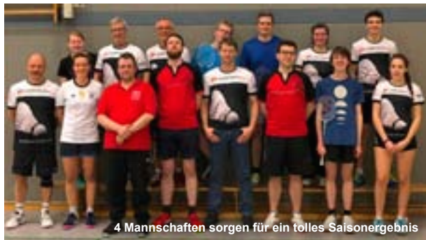
4 Mannschaften sorgen für ein tolles Saisonergebnis

Für alle unsere Mannschaften suchen wir für die kommende Saison weitere Spielerinnen und Spieler. Gerade im Damenbereich sind wir recht knapp besetzt, da immer wieder Spielerinnen aufgrund von Studium oder Beruf in die Ferne schweifen. Alle sind herzlich willkommen am Trainingsabend am Montag.