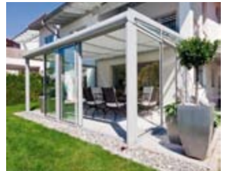
Beschattungs- und Heizsysteme