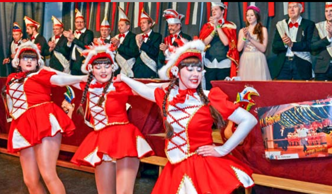
64. Arster Karneval