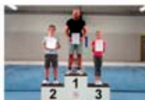
Sieger Gruppe 1