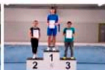
Sieger Gruppe 2