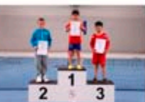
Sieger Gruppe 4