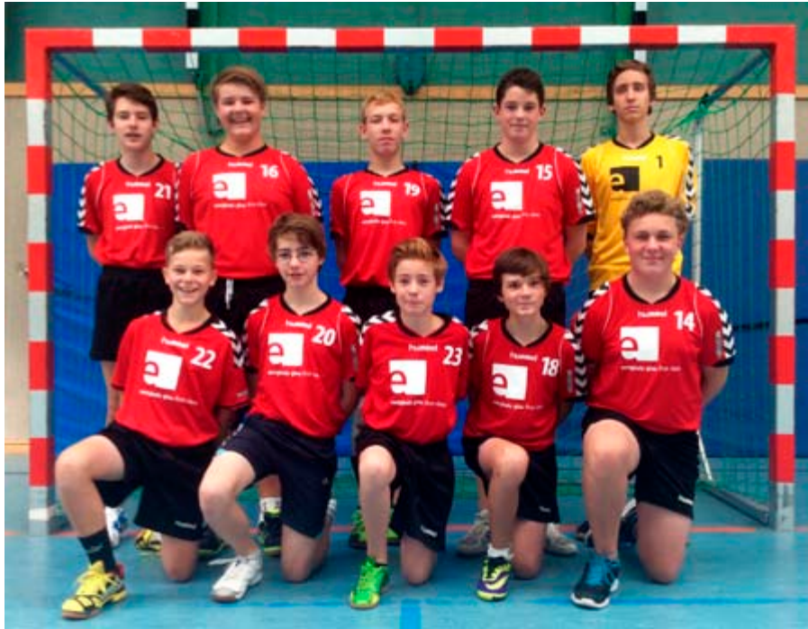
Die männliche C