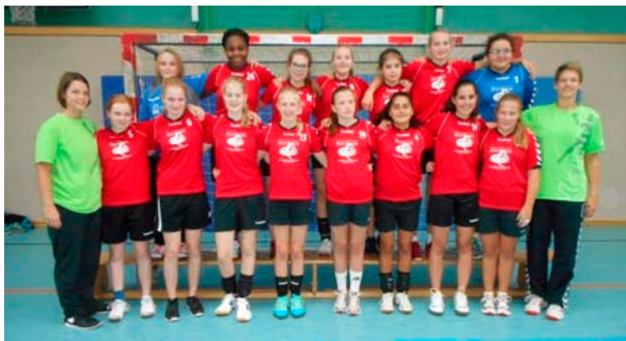
Die weibliche C2