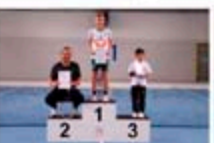
Sieger Gruppe 3