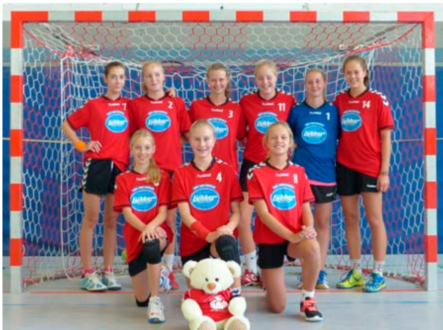
Die weibliche C1