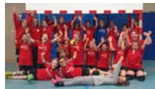
Unsere weibliche E-Jugend, Platz 2. in der Bremenliga