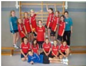
Die weibliche D2

Wir haben einen Stamm von 13 Spielerinnen und ein paar Trainingsgästen, trainieren 2x die Woche und versuchen, uns mit viel Spaß und Motivation zu verbessern. Leider können nicht immer alle Mädchen mitspielen, aber wir bekommen immer tatkräftig aus der E-Jugend Unterstützung. Somit haben wir bei jedem Spiel eine schlagkräftige Truppe zur Verfügung. Außerordentlich möchten wir uns an dieser Stelle bei unseren Eltern bedanken, die uns immer lautstark unterstützen und uns als unsere treuesten Fans zu den Auswärtsspielen begleiten (Auch wenn es mal morgens um 09.00 Uhr nach einer Kohlfahrt ist, nicht wahr, Rossi und Ulf).