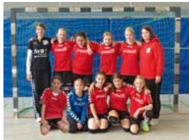
Die weibliche D1