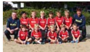
Die männliche E-Jugend, aktuell Tabellenführer in der Bremenliga

Freut Euch auf ein weiteres tolles Event in Arsten und unterstützt unsere Kometen lautstark ... :-)