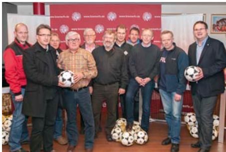
Die Vereine aus „Links der Weser“ freuten sich ebenso über die Präsente...

Mit der Weihnachtsaktion unterstützt der BFV bereits seit Jahren seine Vereine durch Sachgeschenke. So wurden die Clubs beispielsweise bereits mit hochwertigen Notebooks, Netbooks und modernen Laserdruckern ausgestattet.