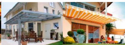
Terrassendächer Rollläden + Markisen Glastüren