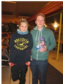
Unsere beiden Unglücksraben