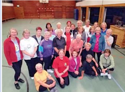
Übergabe der Spende