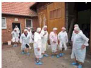
Besichtigung einer Käserei