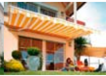
Rollläden + Markisen