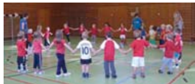
Die Ballsportgruppe in Aktion

Freitag zwischen 15.00 und 16.00 Uhr tummeln sich die aller kleinsten „Handballer“ des TuS Kommet Arsten in der Halle am Korbhauserweg!